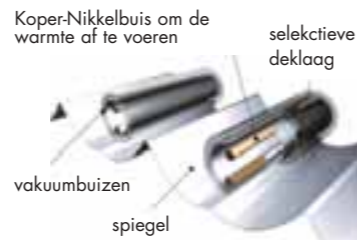
Koper-Nikkelbuis om de warmte af te voeren selektieve deklaag vakuumbuizen spiegel

Uw mening is zeer belangrijk voor ons! Als u vragen, ideeën of adviezen hebt, aarzel niet die aan ons te vertellen.